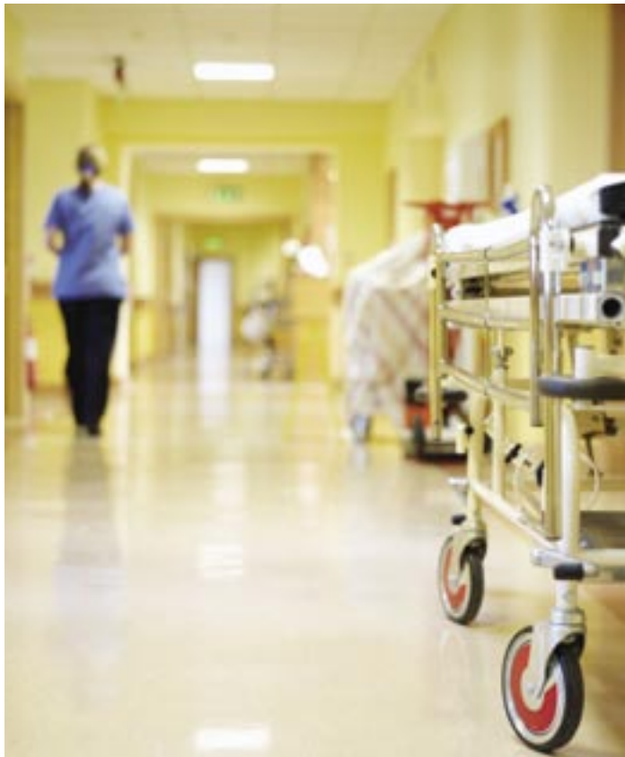
Zorgverstrekkers kunnen voortaan hun medische getuigschriften elektronisch bestellen.