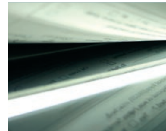
Papieren facturen laten scannen en vervolgens vertalen naar het documentformaat van de boekhoudsoftware levert al gauw een winst van tien euro per factuur op.

U wil graag kosten besparen door met elektronische facturatie te werken, maar uw leveranciers zijn er nog niet klaar voor? Geen probleem. Dankzij Invoice Management, een toepassing die ontstond uit een samenwerking tussen Belgian Post Solutions, Arco, Exbo en Certipost, moeten uw leveranciers alleen nog het postadres op hun papieren facturen aanpassen. Inkomende papieren facturen worden dan ingescand en verder elektronisch verwerkt. Zo plukt u onmiddellijk de vruchten van een volledig geautomatiseerde verwerking van inkomende facturen, zonder dat u grote investeringen hoeft te doen.