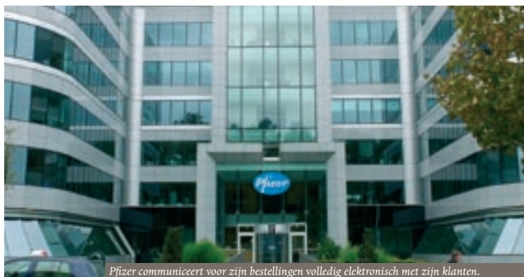
Pfizer communiceert voor zijn bestellingen volledig elektronisch met zijn klanten.

IBS werkte ook bij Pfizer met Certipost samen. Wim Dekimpe, productmanager AIDA bij IBS, licht toe: “Onze klant Pfizer, een