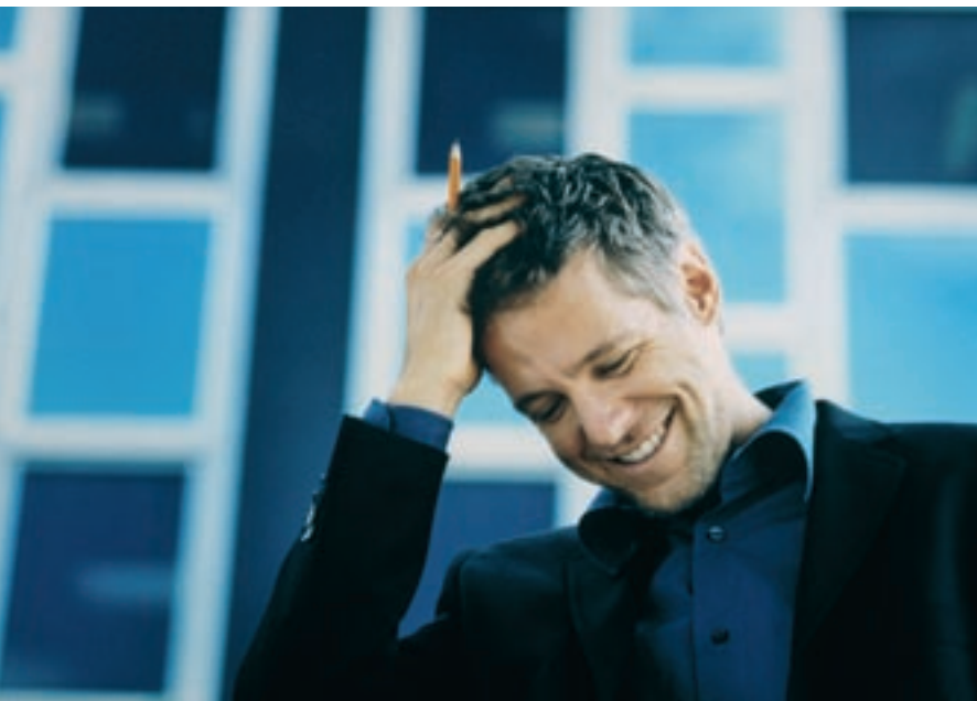
Een op drie Proximus-werknemers opteerde al voor de elektronische salarisfiche. Ze is veiliger dan de papieren versie, dankzij de beveiliging met een gebruikersnaam en wachtwoord.