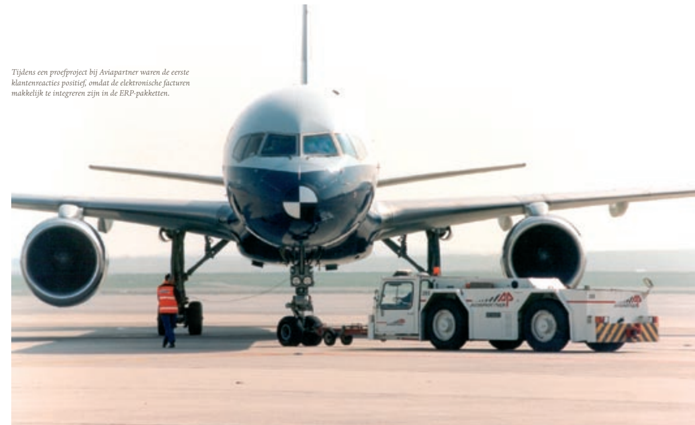
Tijdens een proefproject bij Aviapartner waren de eerste klantenreacties positief, omdat de elektronische facturen makkelijk te integreren zijn in de ERP-pakketten.

Niets uit deze uitgave mag worden gekopieerd of overgenomen zonder een voorafgaande en schriftelijke toestemming van de uitgever. © 2005 Certipost nv. Alle rechten voorbehouden.